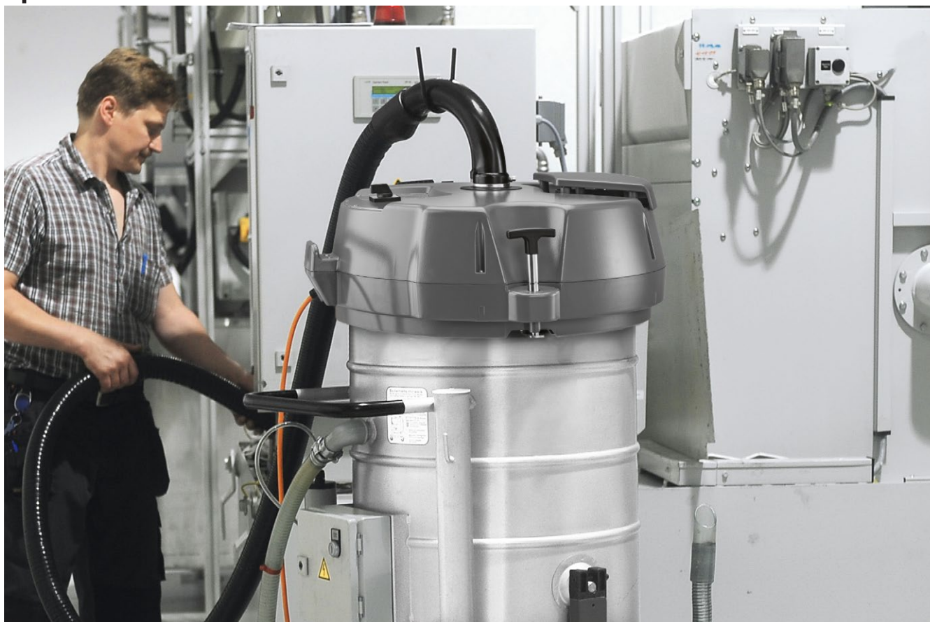
IVR-L 100/24-2 Me